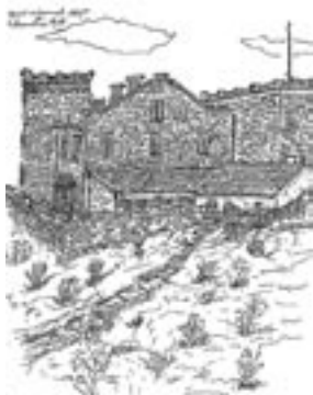
Observatoire de l'Aigoual 1926