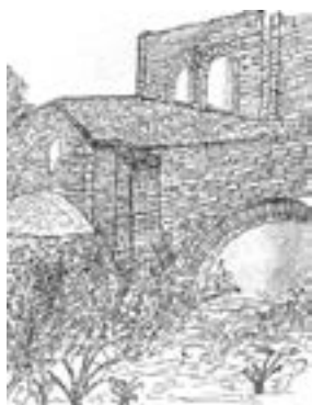
Église de St-Marcel de Fontfouillouse